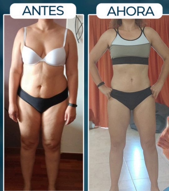
BEA -16 KILOS