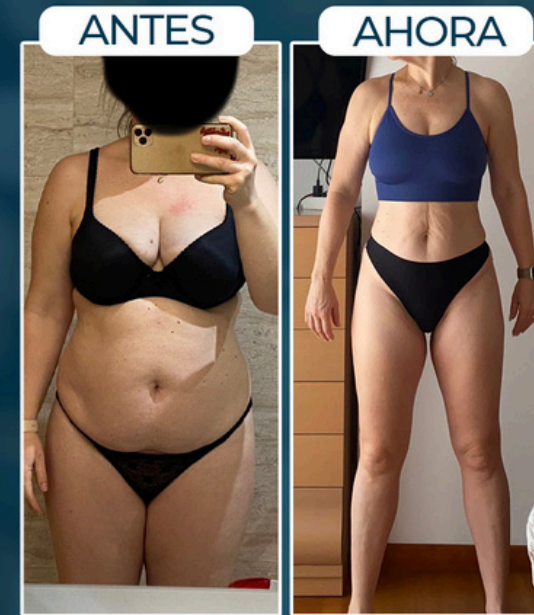
ESTHER -17 KILOS